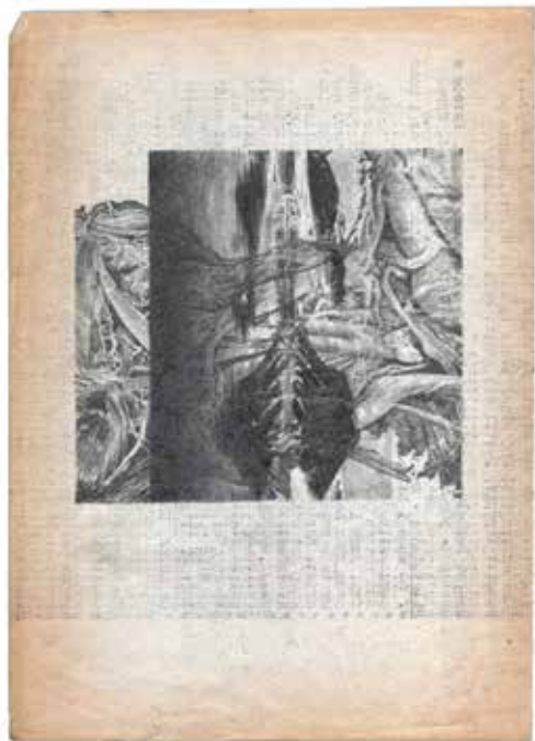
Bio, 2015, 15 x 20 cm, tegning på fasett beev