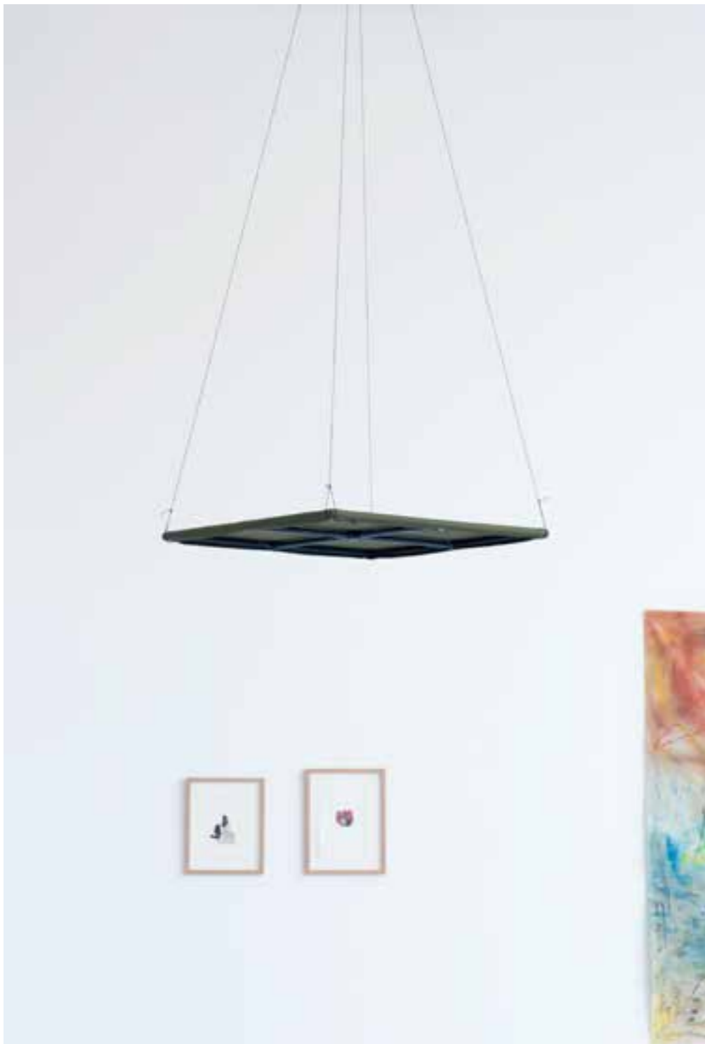
JØRN TORE EGSETH Beskyttelsesmodul