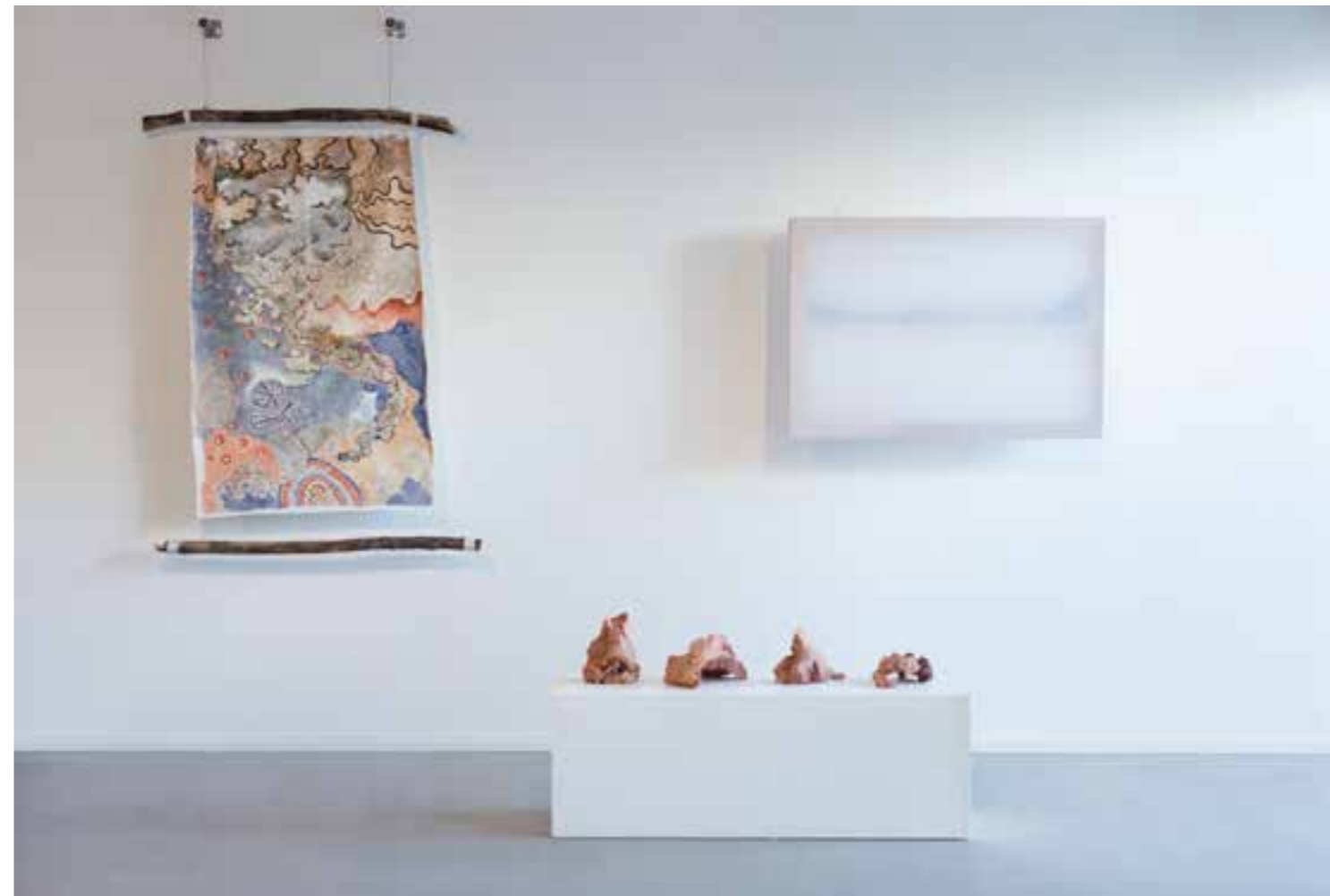
ELIN GLÆRUM HAUGLAND Pigment Painting #10: Sky of berries and sacred ochre