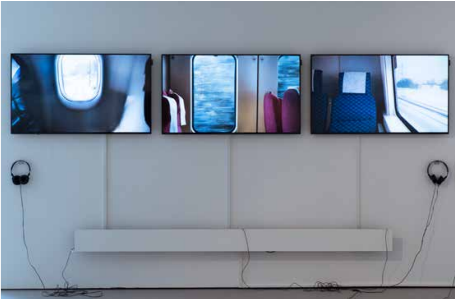
TOBIAS LILJEDAHL Transport