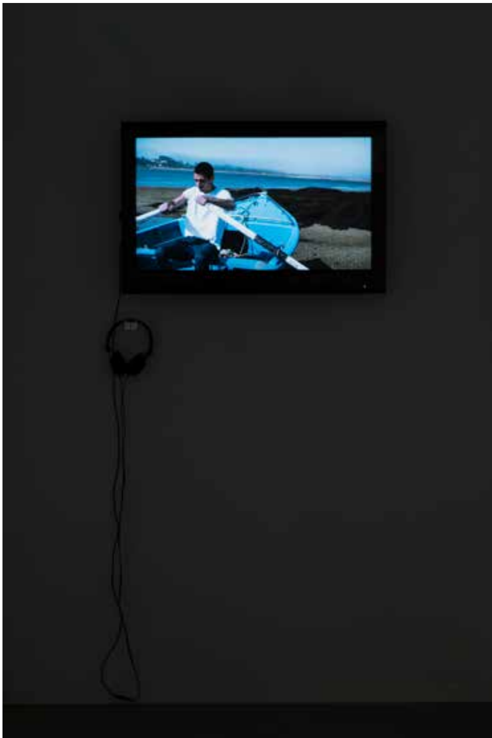
MARGARIDA PAIVA Traversings