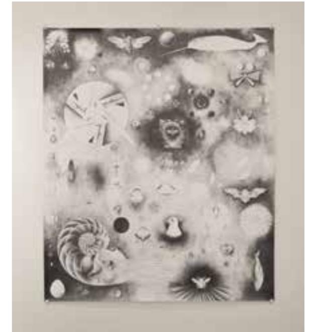
Årets publikumsfavoritt «Uten tittel», blyanttegning på papir av Solveig Bergene