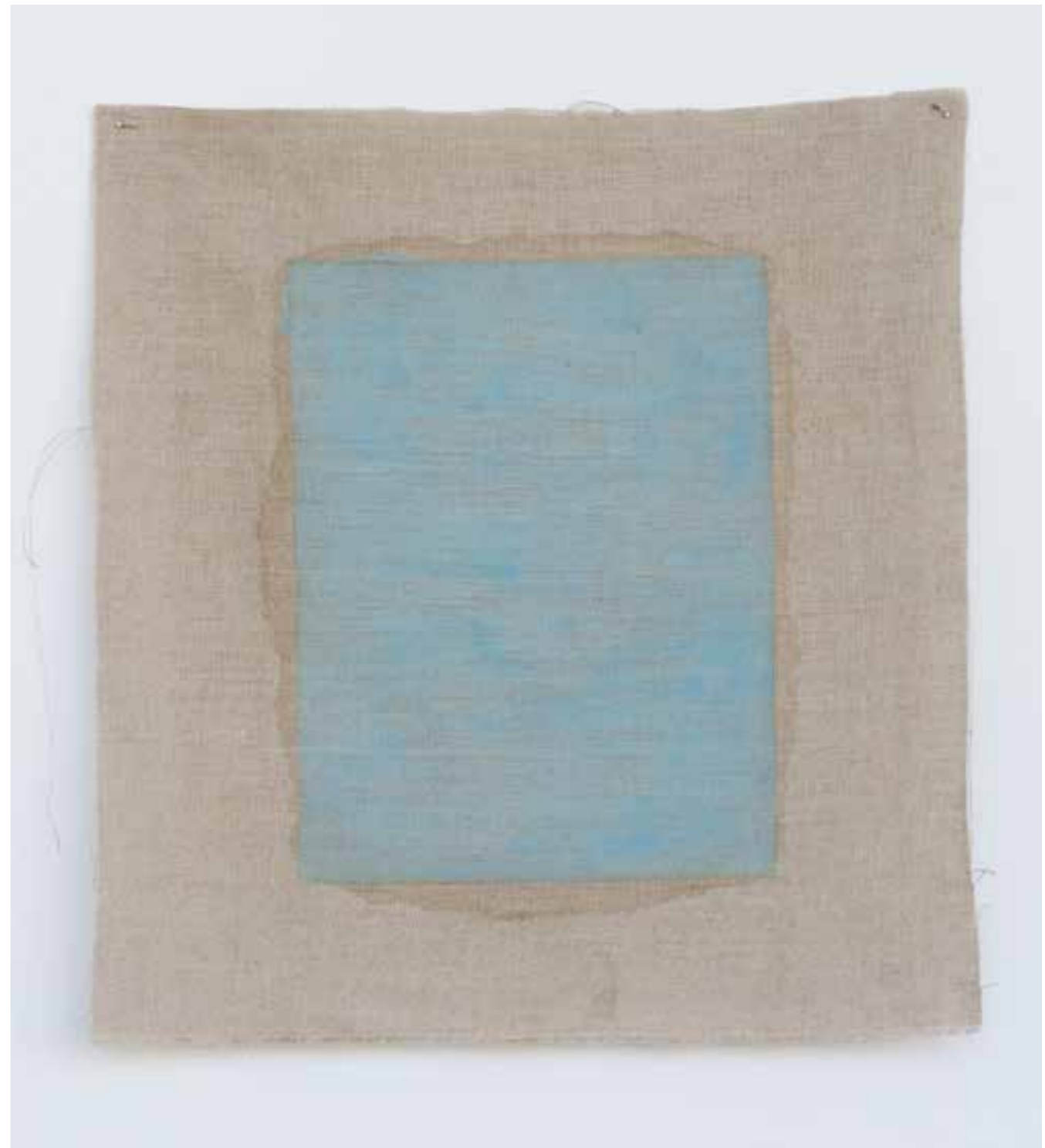
HELGA SCHMEDLING BØE Uten tittel, detalj