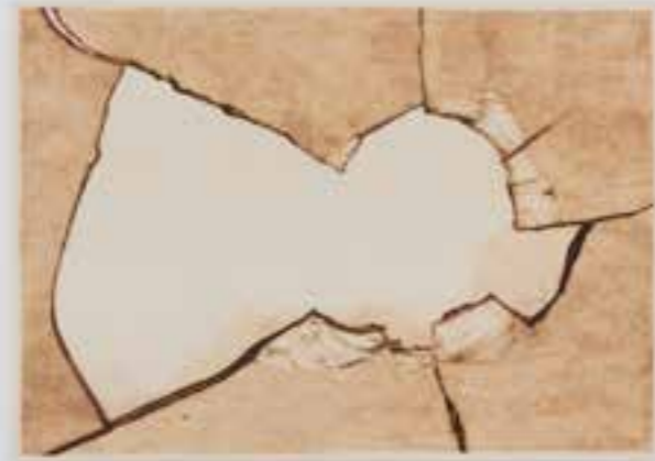
MATILDA HÖÖG Glass