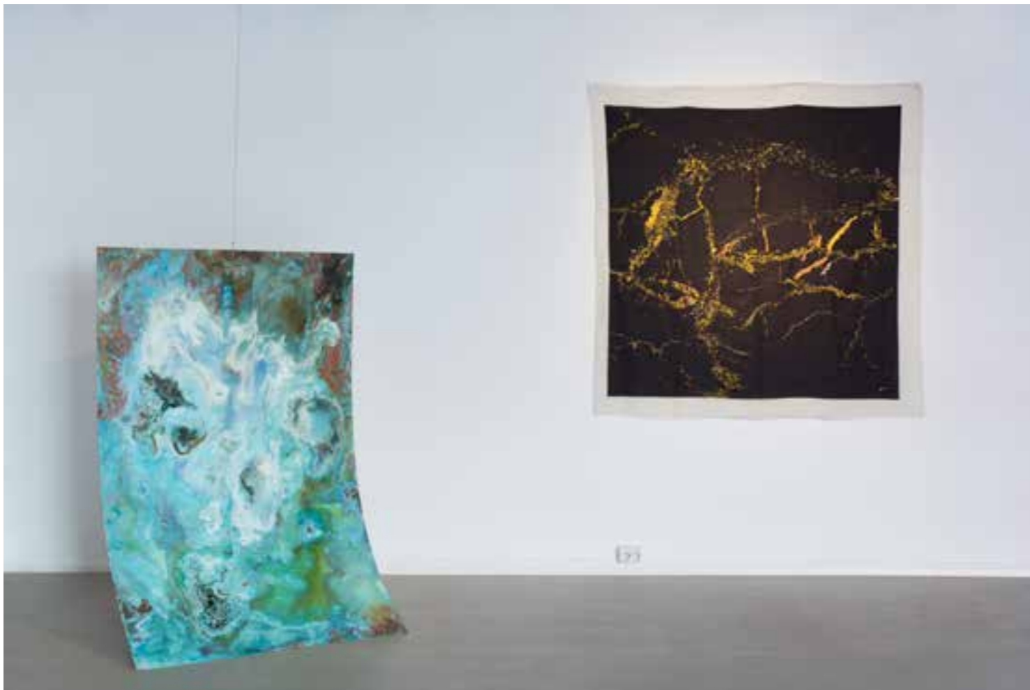
ØYVIND NOVAK JENSSEN Acid/ Corrosion/ Electricity/ Mass-production/ Metal / Heat / Human Energy/ Natural Forces/ Water