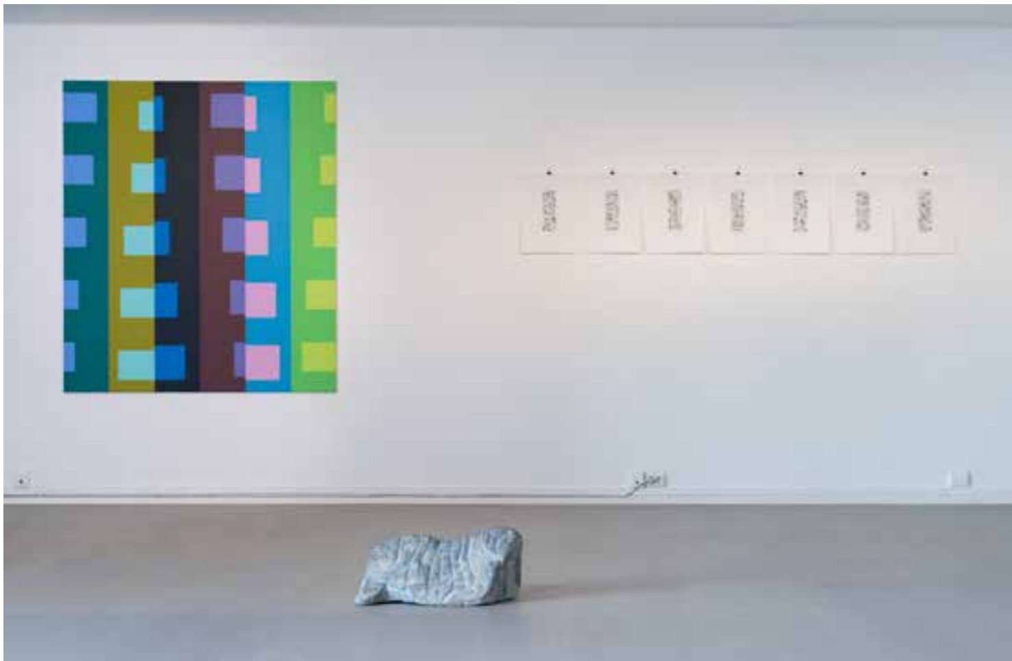
PER FORMO Seks vertikale progresjoner