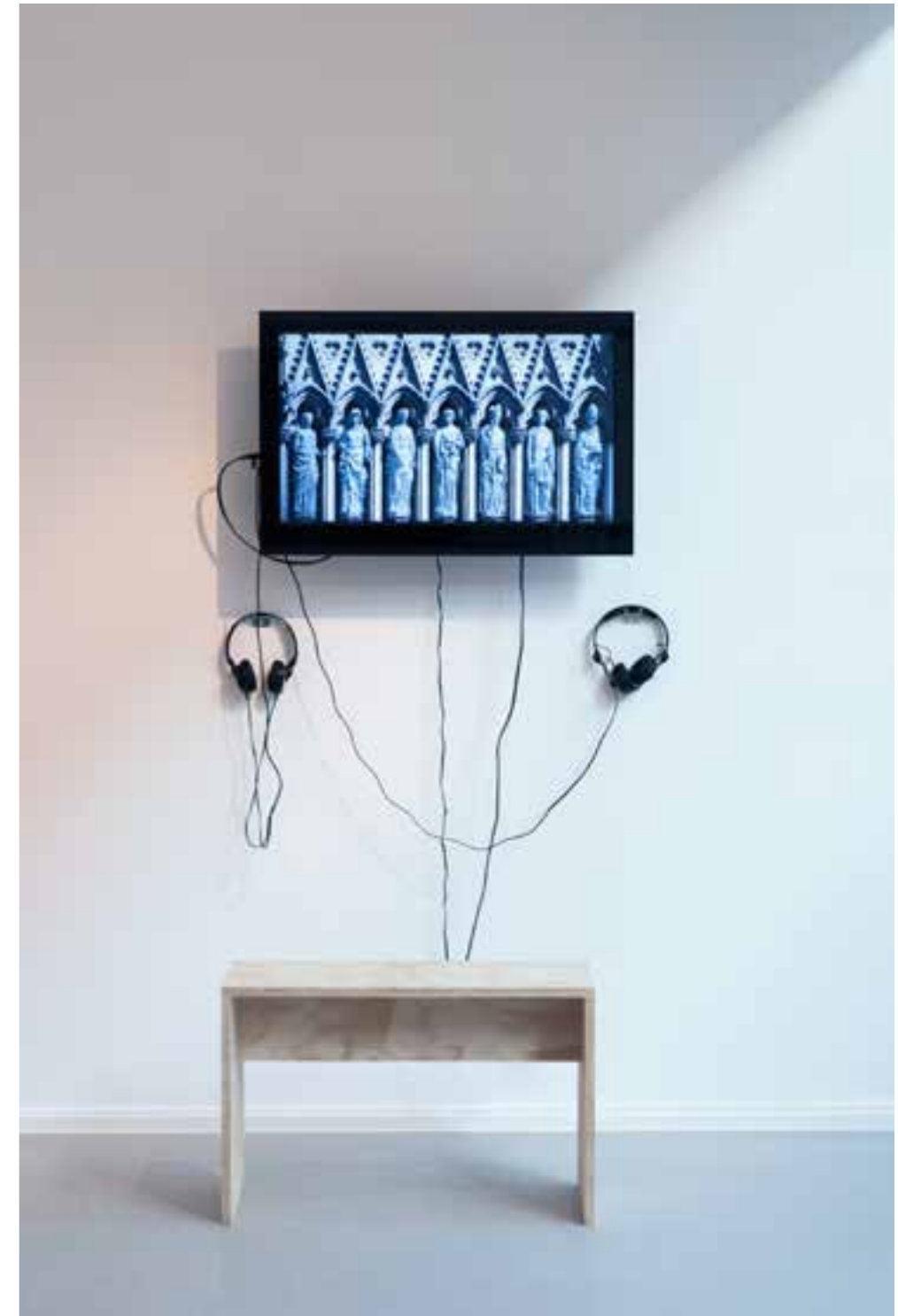
ISMAEL SANZ-PENA Persistence of Vision III