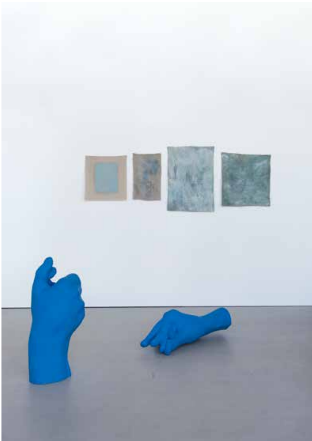
PETTER BUHAGEN Bureaucrats of Experience (scroll) Bureaucrats of Experience (pinch)