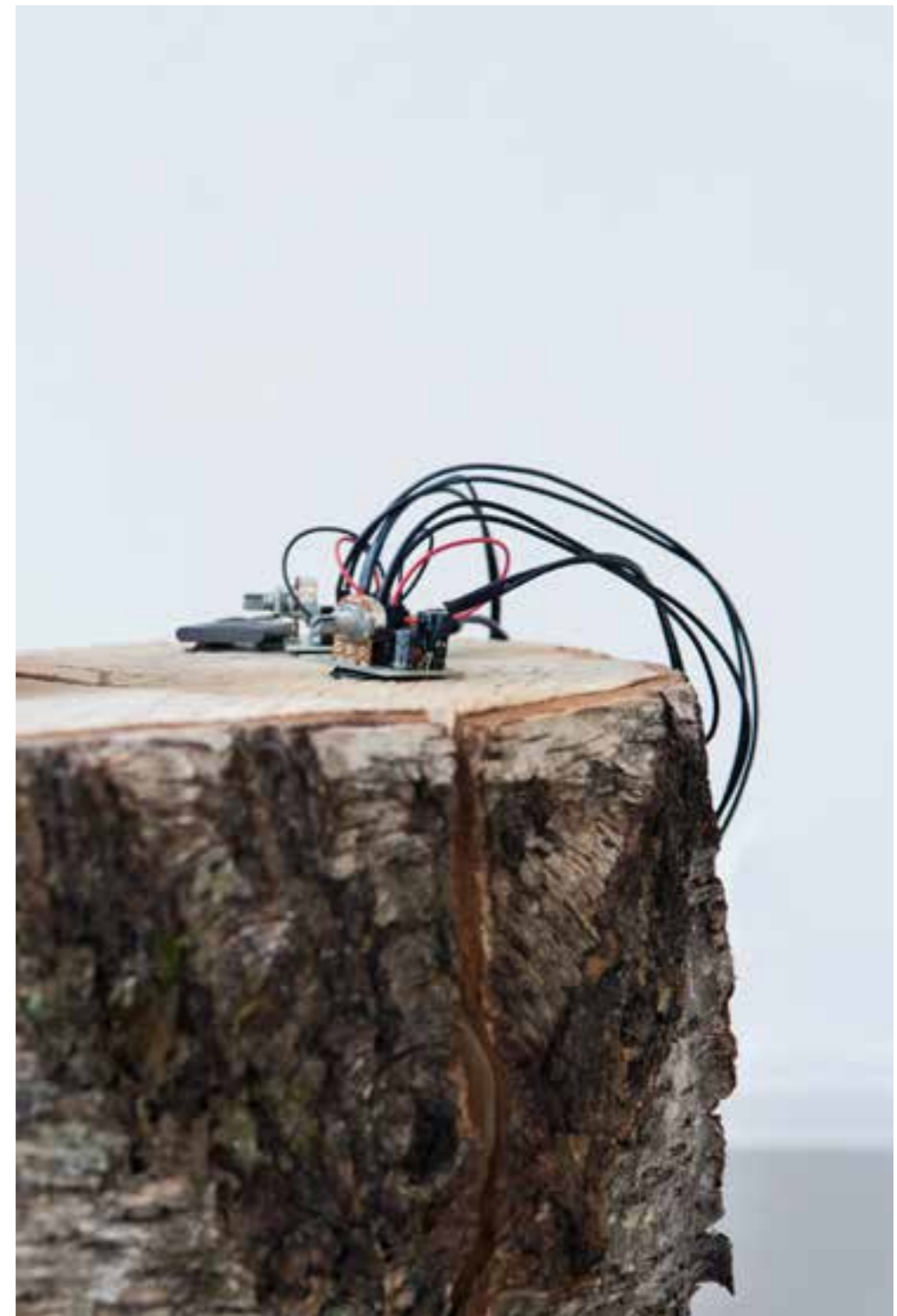
JOAKIM BLATTMANN AV, detalj